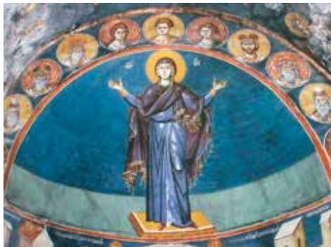
Madre di Dio "Blachernitissa", c. 1295. Ohrid (Macedonia del Nord), affresco della Chiesa di san Clemente (o della santa Madre di Dio Peribleptos).

Finora mi sono riferito però soltanto ad aspetti più o meno esteriori della preghiera, mentre ancora più importante è la sua dimensione interiore. Formule, rispetto dei tempi, gesti sono di grande aiuto ma non l'essenza della preghiera, che è, o meglio