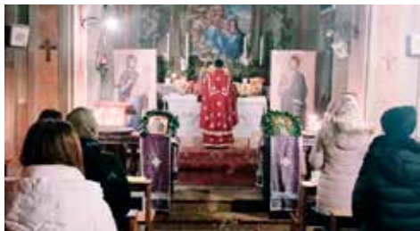
Divina Liturgia in onore di San Nicola