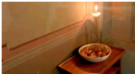
Vespro con Litia (veglia notturna)