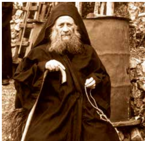
San Giuseppe l'Esicasta (1898-1959) con in mano il komboskini.

Una forma di preghiera interiore molto praticata nell'Ortodossia, che è una delle vie che portano alla preghiera pura, è la “preghiera del cuore”. San Paolo nella Prima lettera ai Tessalonicesi (5, 17) scrive: “pregate ininterrottamente”. Potrebbe sembrare che questa prescrizione superi le possibilità umane. Com'è possibile, tra le necessità del mondo, pregare ininterrottamente? Non la Scrittura, ma la Tradizione apostolica non scritta ha risposto a questa domanda insegnando per generazioni, fino ad oggi, che è possibile, e i monaci esicasti lo hanno confermato nella pratica, attraverso la ripetizione interiore incessante dell'invocazione “Signore Gesù Cristo, Figlio di Dio, abbi pietà di me” (o di formule simili riprese