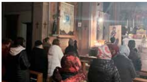
Vespro nella chiesa della Madonnetta