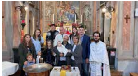
Battesimo nella chiesa della Madonnetta